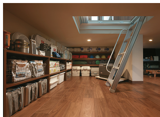
保存食から備蓄までサポートする大収納空間「蔵」。