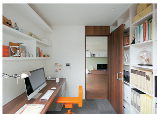
オフィスのように仕事に集中しやすい「ミニラボ」。