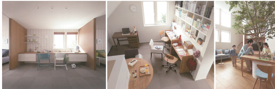
“寝学分離”で集中できる学び空間

ミサワホームでは、寝る場所と学ぶ場所を分けて、勉強に集中できる“寝学分離”をご提案。その一環として、お子さまもご家族も利用できる学び空間「ホーム commons」を設計しています。ご主人が仕事をしている横で、お子さまがリモート授業を受けたり、親子でお互いに学び合ったり、自由に活用できます。