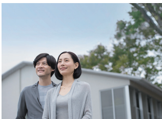
ライフスタイルの変化や転機に寄り添うライフデザインをご提案。