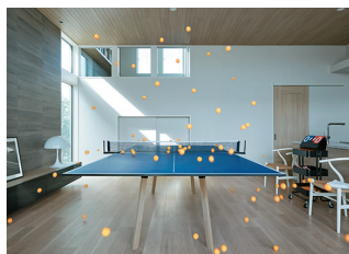
スポーツもできる「多目的パブリックスペース」。