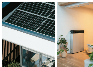
エネルギーの自立を目指す「太陽光発電&蓄電池」。