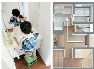
帰宅したらすぐに手洗いでできる「ただいま動線」。