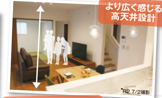
より広く感じる 高天井設計