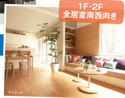
1F・2F 全居室南西向き