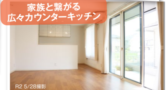
家族と繋がる 広々カウンターキッチン