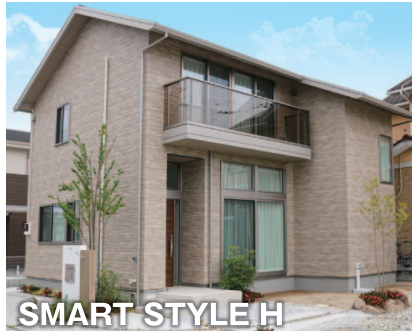
SMART STYLE H

約3mの高天井「蔵」、1.5階の「マルチスペース」など 広く大きく楽しめる住まいです