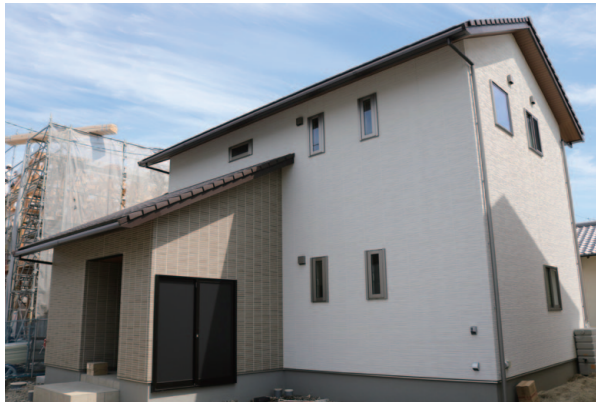
1号地 デザイナーズ住宅