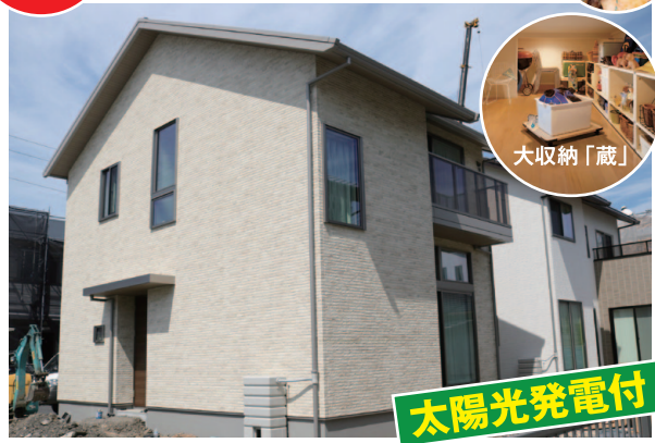
2号地 SMART STYLE H